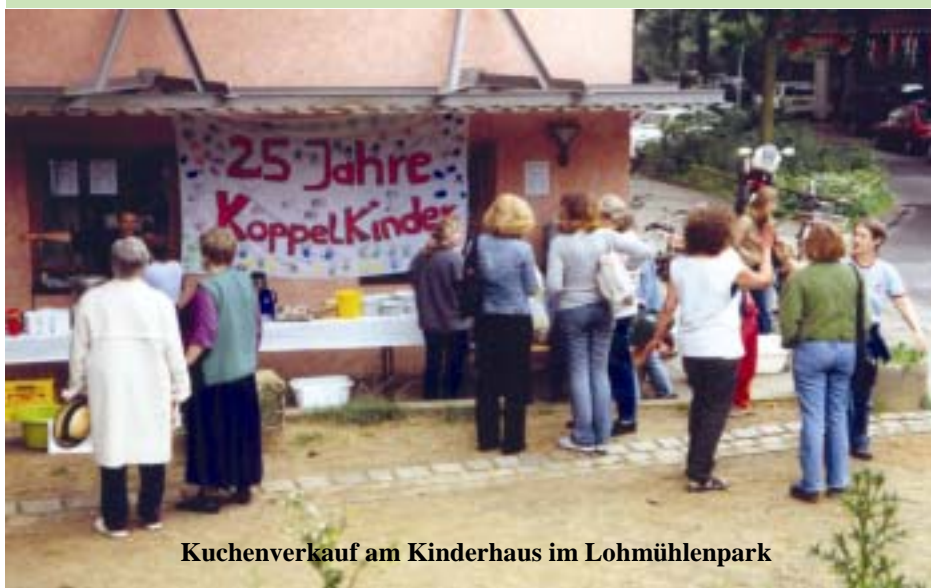
Kuchenverkauf am Kinderhaus im Lohmühlenpark

tiven Szene durchaus umstritten war? Und dass diese Integrationseinrichtung unter den insgesamt 80 Kids heute zehn behinderte Kinder mit begleitet? Das alles und noch einiges mehr kann mensch der neuesten (7.) Ausgabe der schönen Kita-Zeitung „Der kleine Koppel“ entnehmen. Die gibt es gratis bei allen 23 MitarbeiterInnen im Kinderhaus. Am besten einfach bei den GeschäftsführerInnen Sabine Skalla oder Kay Fieguth vorbeischauen! Herzlichen Glückwunsch zum Jubiläum und Dank Euch für das schöne Fest! ■ (jo)