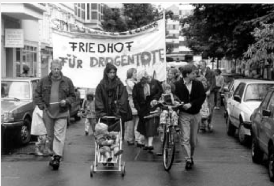
Die Wiederkehr des Immergleichen - eine von zahllosen Drogendemos (hier im Juni 1992)

Im Verbund mit anderen Gremien, Initiativen und Einrichtungen wird der Einwohnerverein in den kommenden Tagen an die Öffentlichkeit gehen, um diese Positionen bekannt zu machen. Wir werden über die Ferienwochen massive Aktionen vorbereiten, um eine drogenpolitische Katastrophe zu verhindern! Am Montag, dem 19. August, könnte es mit einer ersten großen Stadtteildemonstration losgehen... ■ (jo)